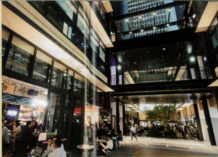
▲華懋旗下的中環街市設計上引入大量綠色元素，例如通風設計，而且裝有監測器，控制何時開燈開冷氣，達到節能減排。

近年ESG（環保、社會責任、公司管治）已逐漸成為企業重視的一環，投資界更將ESG視為應否投資的一大指標，無論企業是否有上市，都開始投入大量資金在ESG。本港地產界近年積極引入綠色建築，例如組裝合成法興建房屋、在設計上加入綠化元素、引入更多自然光，以及用科技監測室內環境等。