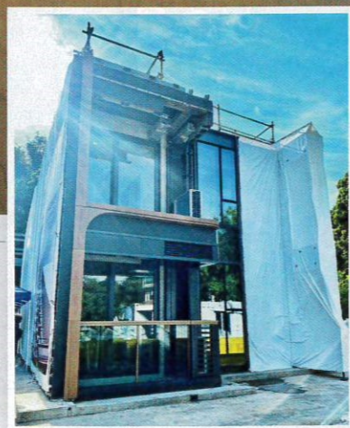
▲組裝合成建築法即是將項目拆成不同組件，並在工廠製造組件，室內裝修及水電在工廠內完成，再直接運送到本港工地裝嵌，有如「砌樂高」(Lego)。